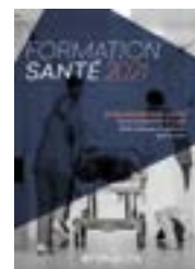
Établissement de Santé