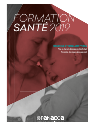
Crèches & Collectivités